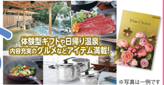
体験型ギフトや日帰り温泉 内容充実のグルメなどアイテム満載!