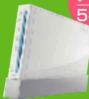
任天堂 Wii Wiiは任天堂の登録商標です。