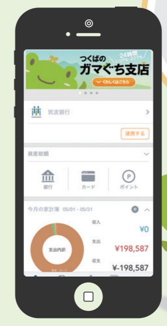
かんたん通帳 Money Forward