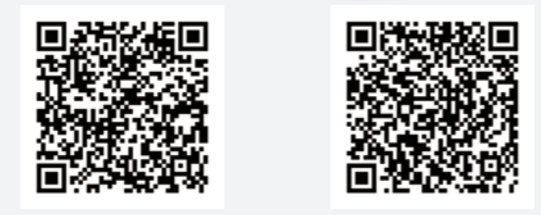
かんたん通帳 Money Forward

※上記は「マネーフォワード for 筑波銀行」の例です。「かんたん通帳」はアプリ画面にてご確認ください。