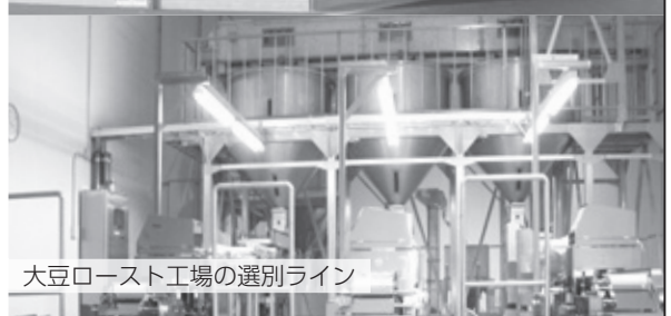
大豆ロースト工場の選別ライン