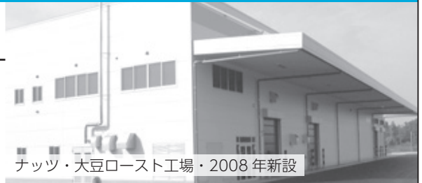
ナッツ・大豆ロースト工場・2008年新設

おいしい国産落花生の原料を全国の加工業者に供給する国産落花生原料問屋として創業し、おいしさの徹底追及のために自社で加工製造することにこだわり、問屋業から製造業にシフトし、落花生→ナッツ類（アーモンド等）大豆のロースト加工にも重点シフトをして、おいしい自社加工にこだわり続ける会社です。