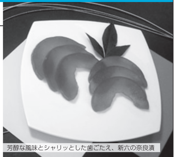
芳醇な風味とシャリッとした歯ごたえ、新六の奈良漬

株式会社 新六本店は、創業明治元年[新六の奈良漬]として、味ひとすじに老舗の暖簾を受け継いでまいりました。利根川水系に育まれた新鮮な瓜・胡瓜・茄子・生姜などを素材に、地酒から生まれた吟醸粕・味噌粕を用いて丹念に漬け込み仕上げた漬物の逸品です。