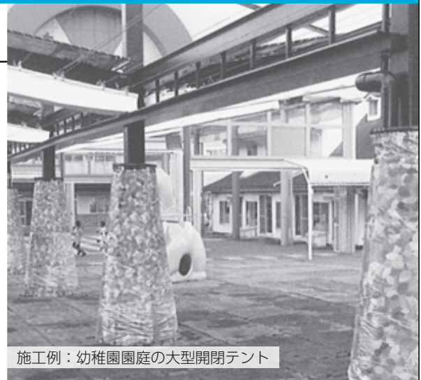
施工例：幼稚園園庭の大型開閉テント

当社は、デザインテントから大型倉庫開閉式テントまで製作、施工しております。 また、インクジェット出力による各種看板や横断幕等の製作もしております。 さらに現在、テント生地を利用した耐久性・耐水性に優れたバッグの製作販売も展開しています。