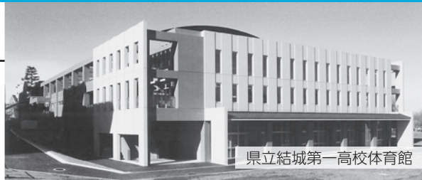
県立結城第一高校体育館

弊社は昭和27年に創業し60有余年に渡り建築設計事務所として永年ご愛顧を頂いております。デザイン、コスト、メンテナンスのバランスがとれた建物を提案させていただきますよう、今後も努力を重ね、皆様からのご依頼をお待ちしております。