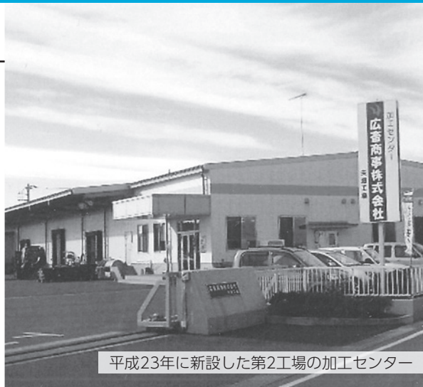
平成23年に新設した第2工場の加工センター

当社は、清潔で高品質な製品を消費者の皆さまにお届けすることを使命として、徹底した衛生管理のもと、真の食の豊かさを求めて、お客様により必要とされる企業として価値ある食品メーカーをめざしております。