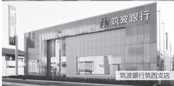
筑波銀行筑西支店