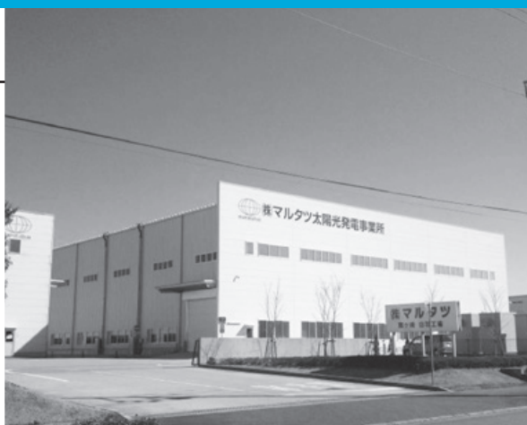
マルタツ本社工場玄関前の写真。 工場屋根上には太陽光パネルによる発電を行っている。

わが社は建設機械をはじめ、船舶、鉄塔クレーン部品、建設部材等の鉄製部品の製造を手掛けて45年。材料調達からプレス加工、製缶、溶接、機械加工、塗装までの一貫生産を行っています。ベテラン社員が若手を指導し、加工技術の継承を大切に考え取り組んでいます。