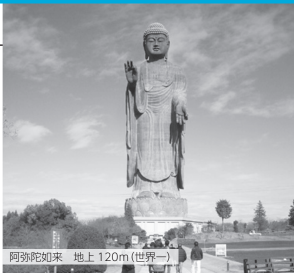
阿弥陀如来 地上 120m (世界一)

弊社は昭和44年4月に東京都荒川区に創業したマンションデベロッパーです。茨城県内では、過去に牛久市の東本願寺の公園墓地の造成と、大仏の建立事業を行いました。現在では自社ブランド「GREEN PARK」として分譲マンションを都心中心に供給しています。