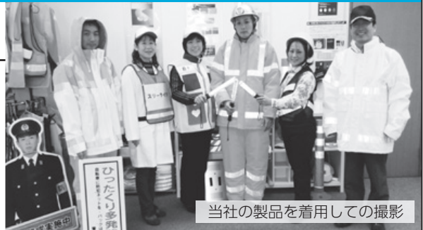
当社の製品を着用しての撮影

当社は1992年反射材の専門メーカーとして創業。反射材を使用した保安用品や娯楽機器向け製品の企画・製造・販売を行っています。現在では反射材が広く普及し“交通安全”“地域安全”“産業安全”などの分野で多くの方に活用されていることは大きな喜びです。