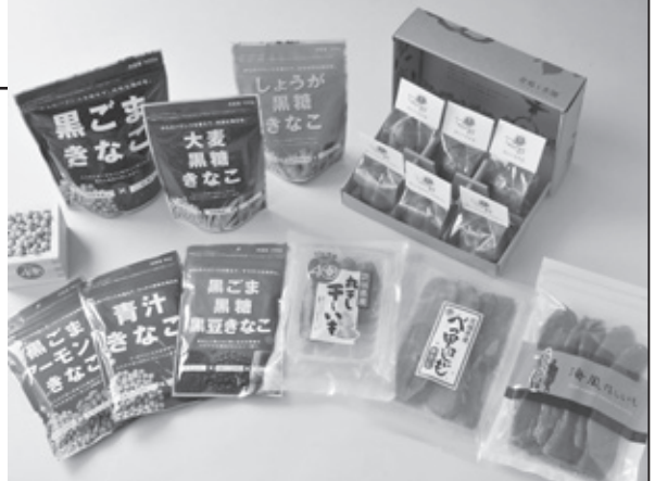
主な商品（健康志向きな粉シリーズ、高品質干しいも、干しいもを使用した焼菓子）

お客様の健康を考えた商品作りを展開し、干しいも、きな粉などに付加価値を加え、美味しく健康に良いもの、より安心安全な商品作りに取り組んでいます。