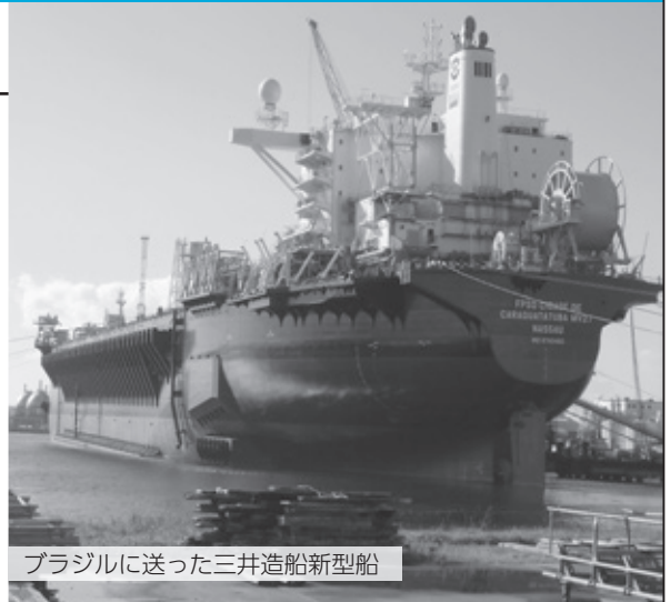
ブラジルに送った三井造船新型船

弊社は、船舶関係の造船制作として設立し、更に大手造船メーカーの取引にて養われた技術により、大手建築分野にも着手し、新規事業分野の開拓に努めて来ました。当社は、【ものづくり】を基盤とする会社として、製造、設計、技術、営業など世界で競争できる価格と技術力のアップを目指して参りたいと思います。