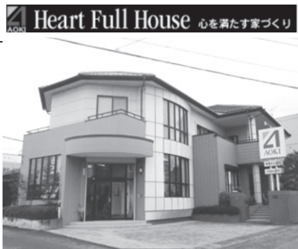
会社・事務所外観

弊社は、ものづくり企業として地域社会に貢献すると共に、「安心、安全」を追求し、「品質、技術」の向上に努めております。長年のノウハウを駆使した総合建設業として、顧客のニーズに柔軟に対応しながら、プランニングから施工まで、お客様に最大限で満足して頂ける仕事をしております。