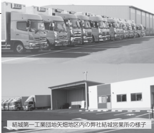
結城第一工業団地矢畑地区内の弊社結城営業所の様子

公道をお借りして運賃を頂いているため、周りの車両に迷惑を掛けない運転を教育しています。