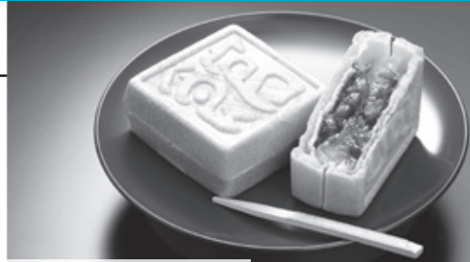
菓子博名誉大賞「館最中」

当社は、筑西市下館駅北口にて、「ほんものがある 心がある 湖月庵の和菓子」をモットーに、素材にこだわった和菓子づくりをしております。このたび、筑波山を背景に走るSLをデザインした新商品『SLこっとん』を発売しました。企業ロゴなどオリジナル商品への対応も承ります。お気軽にご連絡ください。