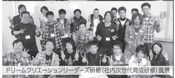
ドリームクリエーションリーダーズ研修(社内次世代育成研修)風景