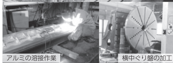
アルミの溶接作業