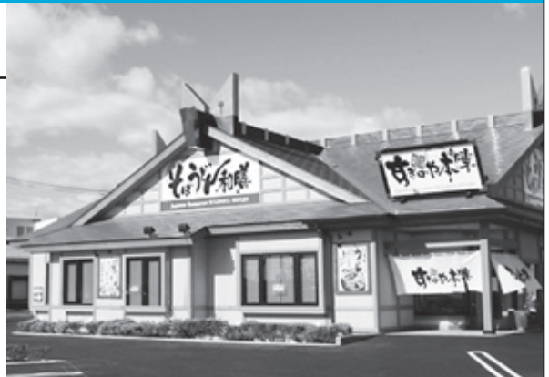
そば・うどんを中心に幅広いメニューを提供する和食レストラン すぎのや本陣

弊社は今年創業45年。おかげさまで茨城県内28店舗、栃木県9店舗、埼玉県5店舗、千葉県6店舗、宮城県3店舗合計51店舗の飲食店を営業しています。業態は和食レストランすぎのや本陣、手打ちそばすぎのや本陣雅庵、居酒屋しきぶ亭。そば元本舗、茨城空港スカイライトカフェ、宅配すしすぎのや一番となっています。安全安心で健康に良く、3世代に喜んでいただける店舗展開を行っています。