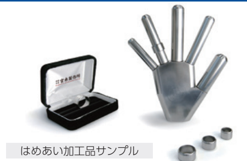
はめあい加工品サンプル

弊社は主に圧延機械用部品、船用内燃機関・減速機部品などの中物・大物機械加工を行っております。小物品では焼入れ・研磨・コーティング処理（協力工場様と連携）や、はめあい加工、精密加工も可能です。さらに構想図から図面を作成したり、現物品を測定して複製品を製作するリバースエンジニアリングの技術・経験も有しております。今後それぞれの分野における熟練技術者のノウハウを共有することで互いに技術を高め合い、お客様の様々なご要望に対応できる体制づくりを行ってまいります。