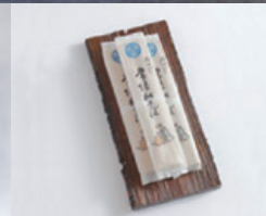
石臼びき 常陸秋そば