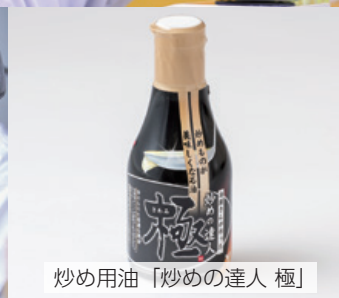
炒め用油「炒めの達人 極」