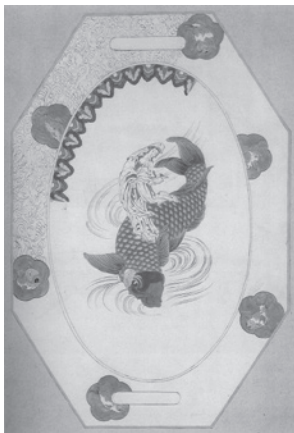
← ジュール・ヴィエイヤー工房 作「日本風食器セット」の一 部 1880年

日本では極端な非対称の配置や比例法が好んで使用され、画面に新鮮な感覚をつくりだしていたのです。これに対し西洋画のモチーフは、中央あるいは中央よりやや寄った黄金比の位置に置くのが常道となっていました。