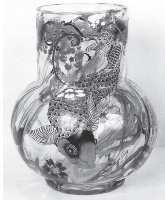
■エミール・ガレ「鯉魚紋花瓶」パリ装飾美術館 1878年 モチーフの鯉の像は、北斎の「魚濫観世音」

日本人の美意識は今や、グローバルな美の基準となったということかも知れません。21世紀、その次の時代にもジャポニスム、つまりカッコいいクールジャパンの日本文化の潮流は、当分の間、廃れることはないでしょう。