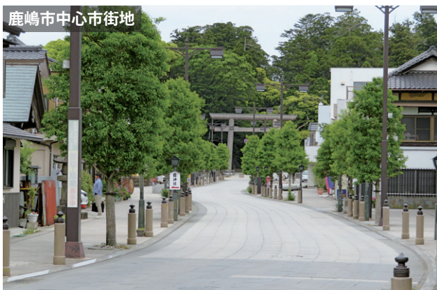
鹿嶋市中心市街地

空き店舗を埋める取り組みとしては、補助金による支援や、期間を限定して出店するような柔軟な利用の提案を行っていきます。コロナ禍が収束して観光客が戻ってくるようになれば、古武道体験や、浴衣を着て鹿島神宮周辺を散策することなど体験型の観光も行いたいと考えています。