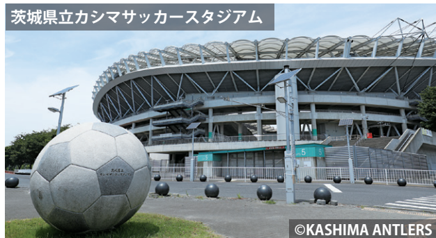
茨城県立カシマサッカースタジアム

本市にスタジアムが継続して所在することで、スポーツを通じた市民生活の向上や賑わいの創出、新旧スタジアムの建設と解体、インフラの整備事業などによる雇用の創出につながることを期待しています。