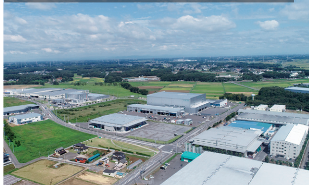
坂東インター工業団地から新規工業団地（山地区）方面を望む

圏央道の4車線化工事が進捗しており、茨城県でもこの機運をとらえて積極的な企業誘致を進めることを検討しています。IT分野の成長と半導体不足、SDGs、CO 2 削減といった世界的な課題への対応とともに、海外の工場を国内に戻し、サプライチェーンを再構築できるような企業の誘致を目指して、今年度中に調査と誘致活動を実施し、2023年度に着工する見込みです。