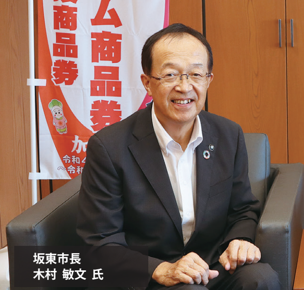
坂東市長 木村 敏文 氏