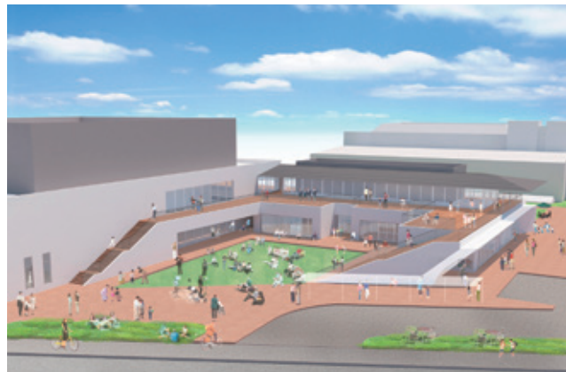
「(仮称)新たな文化的施設」の鳥瞰イメージ

を図るため、2024年度以降に小学校へ入学する児童に対し、ランドセルを贈呈する新たな事業を始めました。