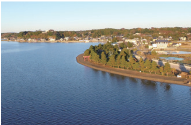
茨城町のシンボル「酒沼」