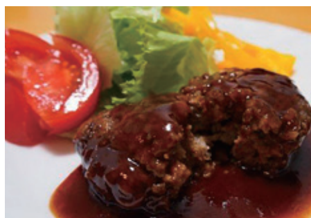
常陸牛ハンバーグ