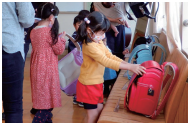
ランドセル見本展示会の様子

移住促進策としては、町内に転入し住宅を新築・購入する若者世帯や子育て世帯に対する補助や、結婚新生活を支援するための補助を実施する予定です。