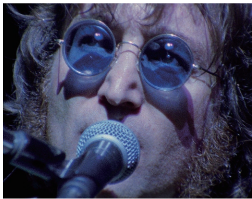
© 2025 Yoko Ono Lennon.Lennon and John Lennon are trademarks of Yoko Ono Lennon.