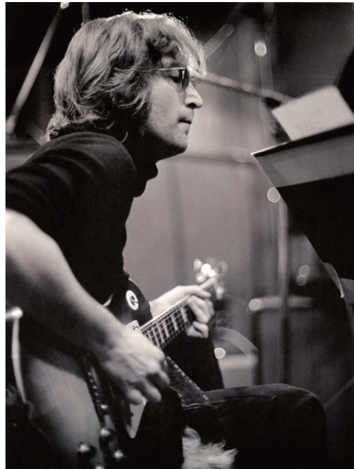
© 2025 Yoko Ono Lennon.Lennon and John Lennon are trademarks of Yoko Ono Lennon.