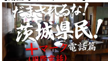
【動画その2イメージ】