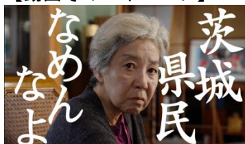
【動画その1イメージ】