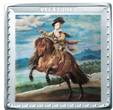
プラド美術館200周年記念コイン