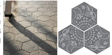
六角形モザイクタイルのモチーフ

写真家ポー・オードゥアールが撮影した、アントニ・ガウディの最も有名な肖像を緻密な彫刻で刻印。左側には、ガウディが1904年にデザインし、カサ・バトリョやカサ・ミラの床、グラシア通りの歩道などに使われている代表的な意匠の一つである六角形のモザイクタイルを配置。コインの周囲には、グエル公園の入り口にある建物の屋根根をモチーフにしたモダニズム様式の装飾を刻印するなど、ガウディ建築の象徴的な美学を添えています。上部には、「Antoni Gaudi」と刻印。