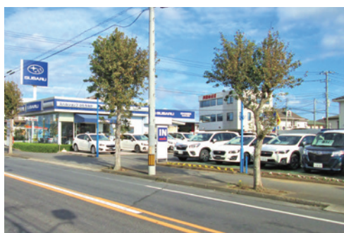
fourdrive ひたちなかスバル店