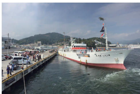
気仙沼での出航風景

弊社は、江戸中期から漁船漁業を営んでいます。昭和30年代頃までは、近海でマグロ、サンマ等を漁獲していましたが、その後、遠洋マグロはえ縄漁業に転換しました。