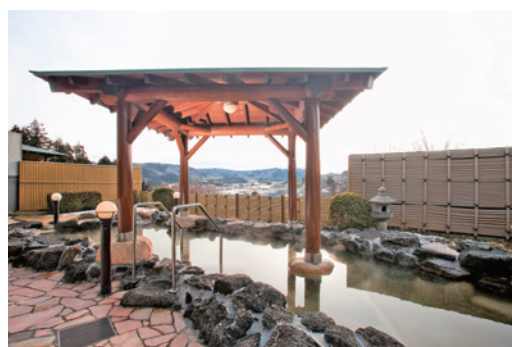
「ごぜんやま温泉保養センター 四季彩館」の露天風呂

弊社は、常陸大宮市を代表する温泉・温浴施設「やまがたすこやかランド 三太の湯」、「ごぜんやま温泉保養センター 四季彩館」、「美和 ささの湯」の管理・運営を行う団体です。「久慈川」、「那珂川」の2つの清流と緑の大地に包まれた自然豊かな常陸大宮市の良質な温泉をぜひお楽しみください。