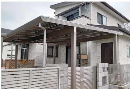
当社事務所に設置したソーラーカーポート

当社では、蓄電池事業をはじめ、ソーラーカーポート事業、住宅用ソーラー事業、メガソーラー事業、リゾート開発・田舎暮らし事業で、「電気の地産地消」を提案しています。