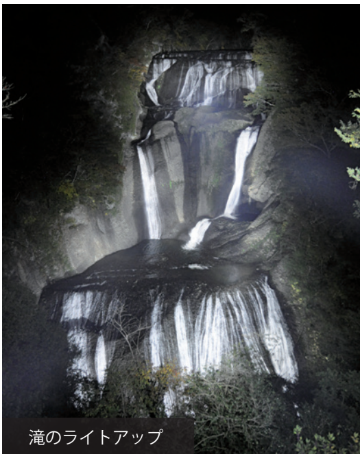
滝のライトアップ