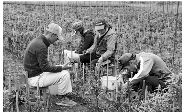
収穫作業の様子（知的障害者授産施設しろがね苑）

加えて、収穫時の農作業の補助や製品作成などの軽作業現場出張サービスといった、施設外でのサービス提供に積極的に取り組んでいます。