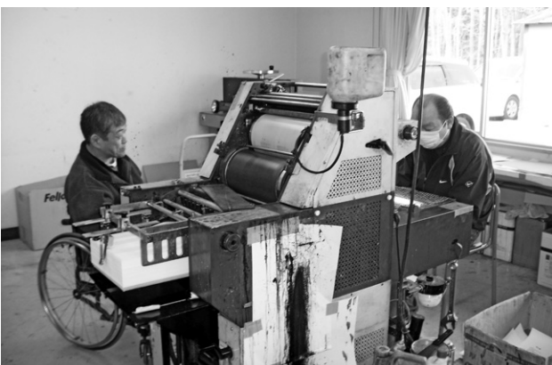
印刷業務の様子（水戸市身体障害者就労支援施設のぞみ）

「水戸市身体障害者就労支援施設のぞみ」では、印刷機器を備えており、報告書や論文、文集、封筒、名刺（点字入りも可）など、幅広い印刷に対応しています。また、付随してダイレクトメールの折り込みなどにも対応しています。