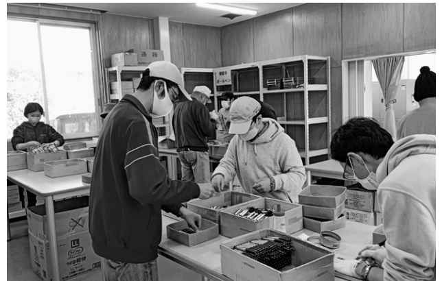
文具組立業務の様子（障害者支援施設はーとふる・ビレッジ）

別に効率的に進めています。根気が必要となる細かい作業にも精力的に取り組み、集中的に仕事をこなしています。