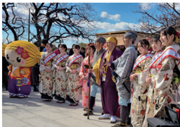
オープニングセレモニー