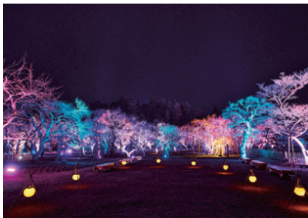
偕楽園 UME The Lights 2026 (東西梅林)