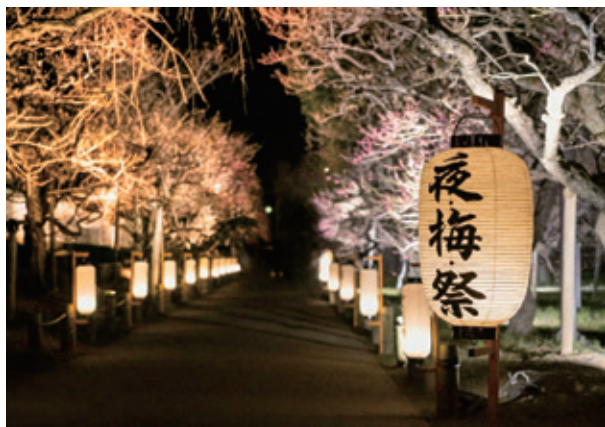
夜・梅・祭 2026 ～水戸城～(弘道館梅林)