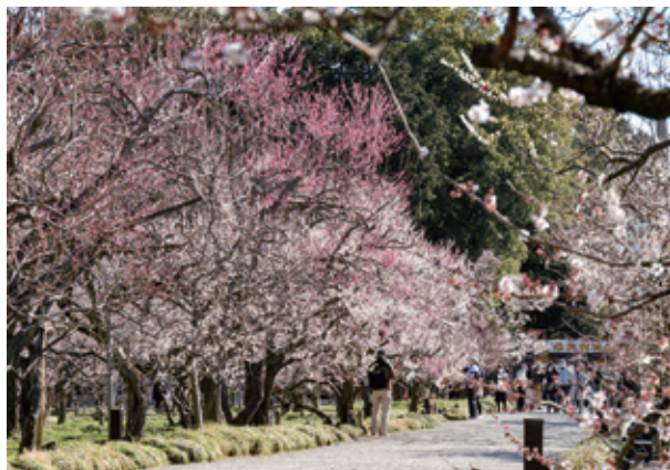
観梅時期の偕楽園