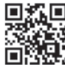
偕楽園 UME The Lights