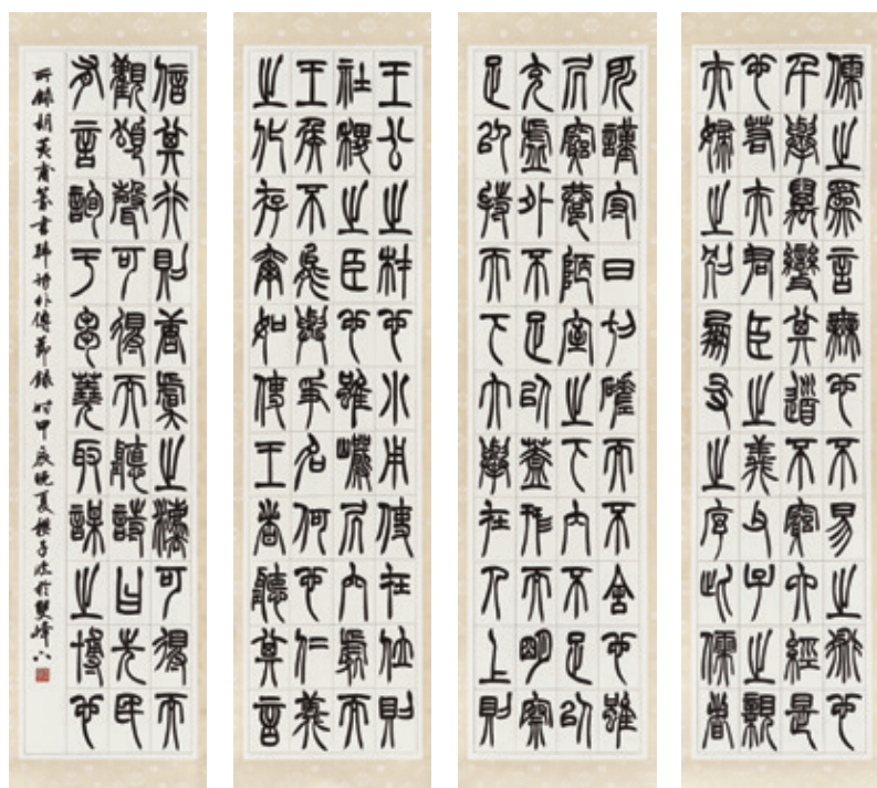
臨 胡澍 漢詩外伝節録