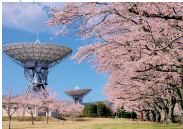
高萩桜まつり～桜フェス～