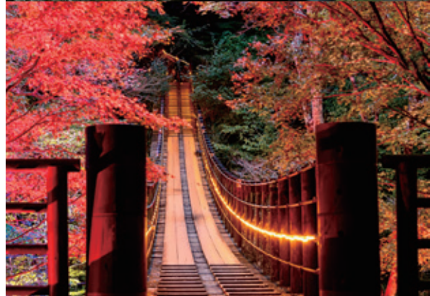
花貫溪谷紅葉まつり